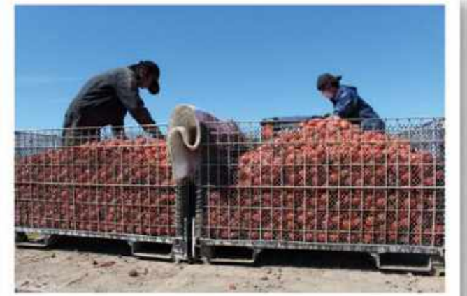
▲収穫後のトマトを平らにならしながら、目についた傷みトマトを外している様子。

昨今の異常気象により酷暑となるなか、トマトの生育にも影響がでています。また、生産者の数も減少しています。夏場の過酷な収穫作業などをする生産者を少しでも応援するため、予約をして加工用トマトの生産者を応援していきましょう。