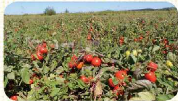
▲北海道の広大な畑

トマトは畑で栄養素と旨み成分をたっぷり蓄えながら真っ赤に熟します。そんな 完熟トマトの味と栄養を損なうことなくお届けしたい 。だからグリーンコープは収穫したトマトを加工する「シーズンパック」にこだわり続けます。